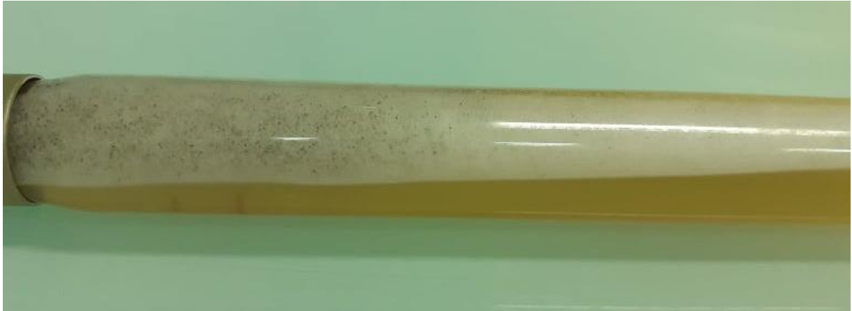
Figure 2 : Culture sur milieu Sabouraud Chloramphénicol sans actidione (J7)