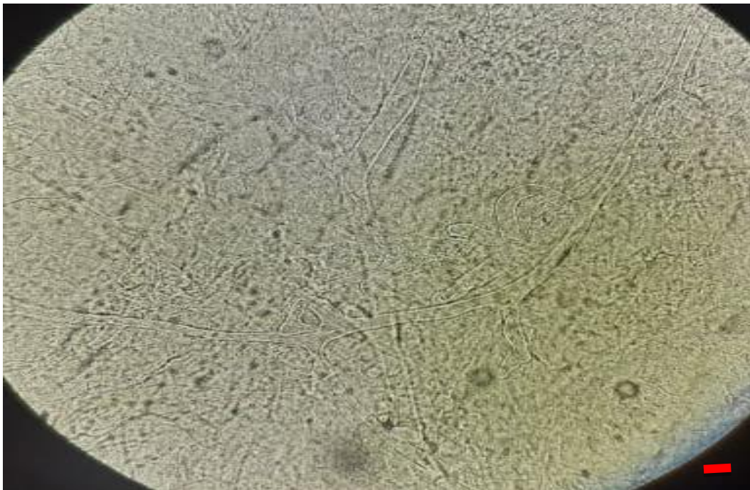
Figure 1 : Examen direct au lactophénol (échelle ×10)

La biopsie de la tuméfaction a montré les images suivantes :