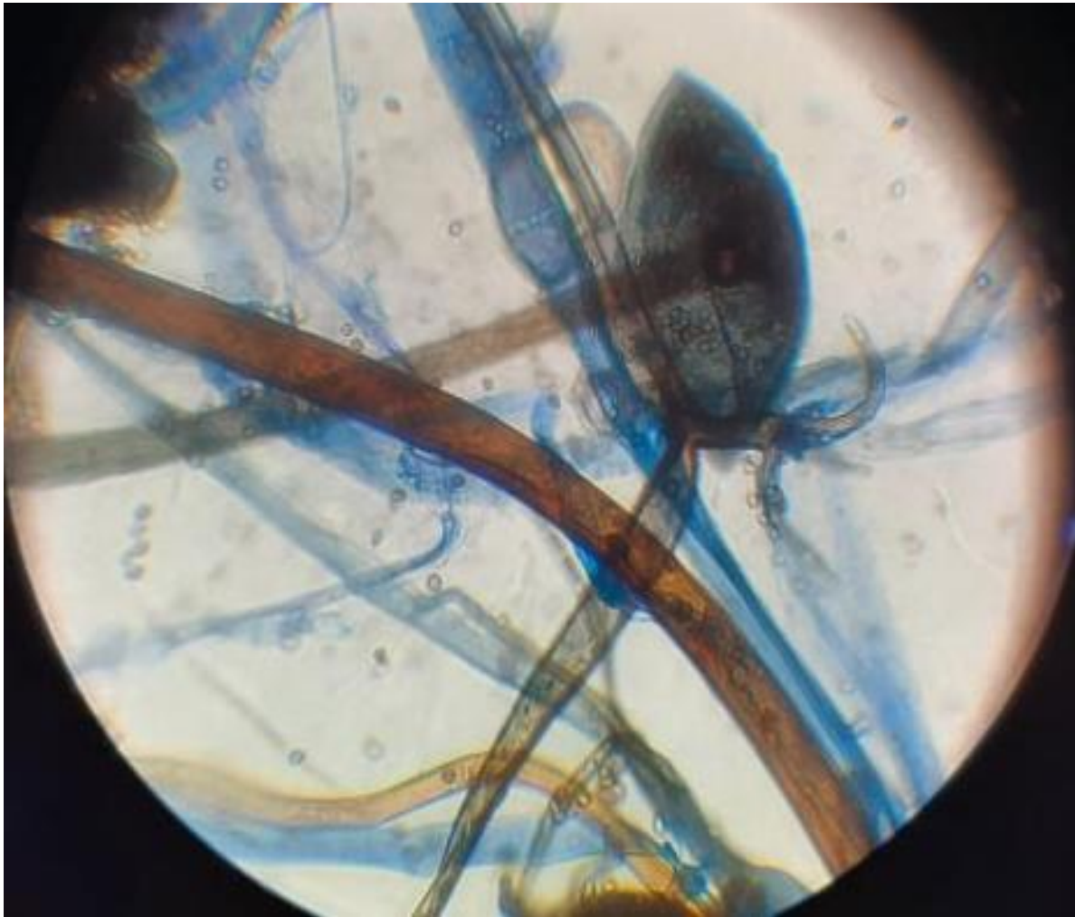
Figure 4 : Observation microscopique de la colonie au bleu de lactophéno (objectif X40)